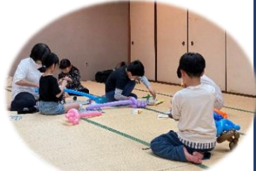
ペンシルバルーン!