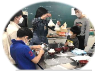
パッククッキングで