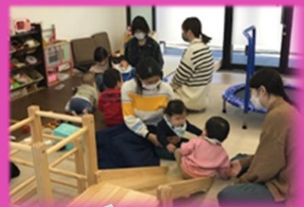
スタッフと、ちびっこ連れのピアサポーターがいます♪