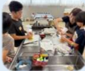
↑ かんたん親子丼 ↓ たこ焼き