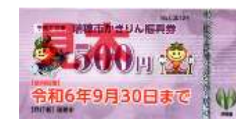
・瑞穂市子育て応援かきりん振興券