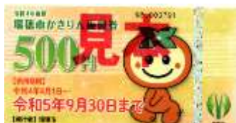
・瑞穂市かきりん振興券